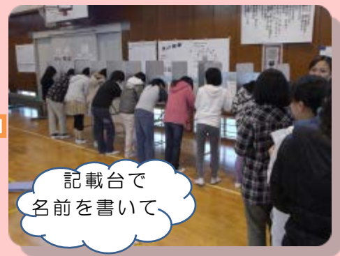
記載台で 名前を書いて