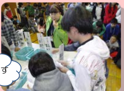
慎重に 開票します