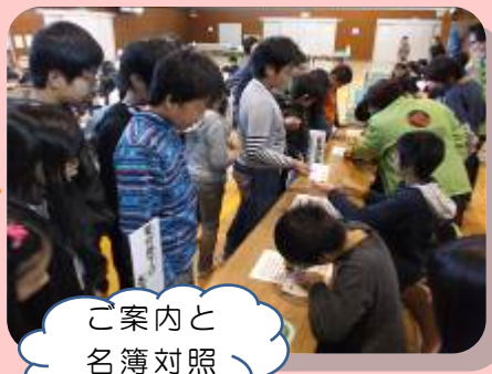
ご案内と 名簿対照