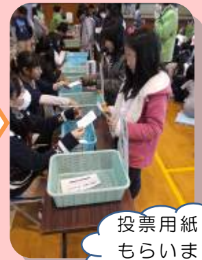
投票用紙を もらいます