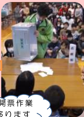
開票作業 に移ります